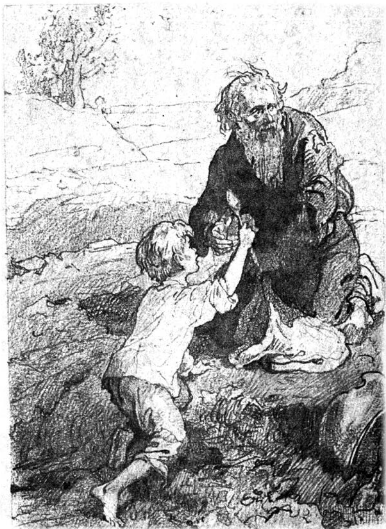
Однажды Илья нашёл большую серебряную ложку...