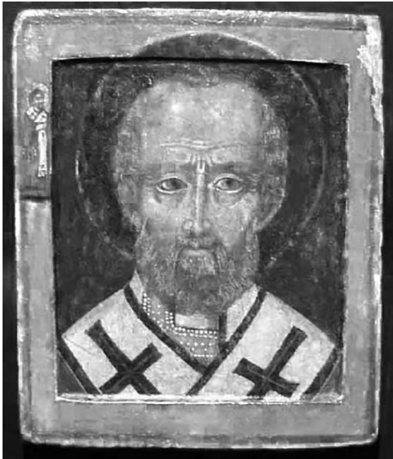
Икона Святителя Николая Чудотворца