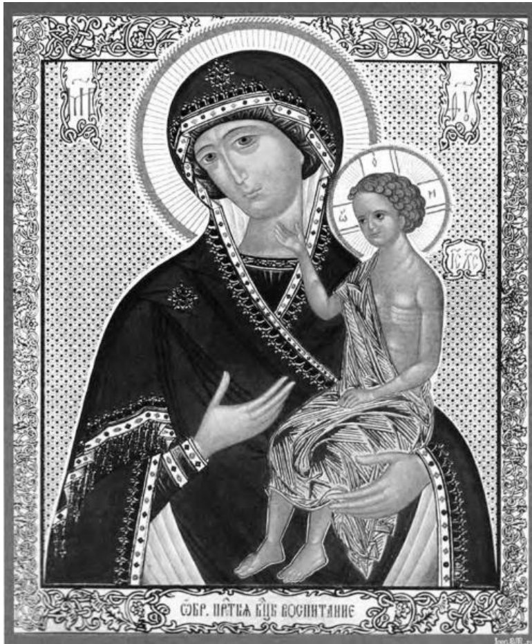
Икона Пресвятой Богородицы «Воспитание»