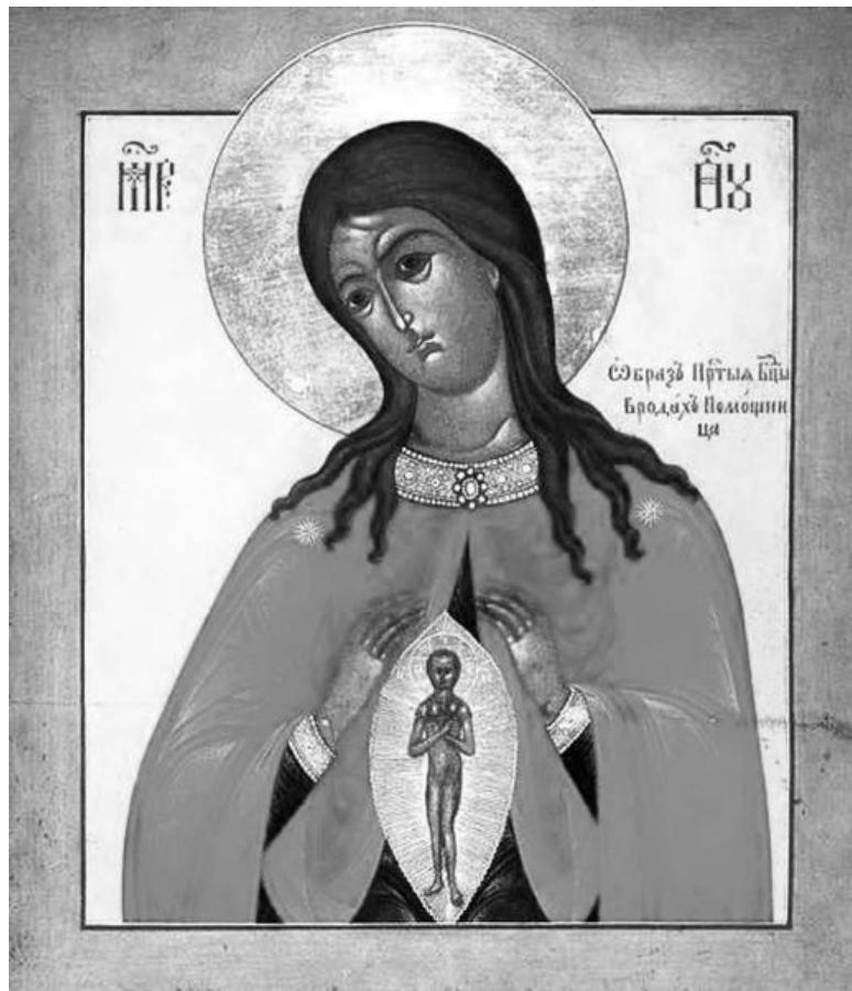
Икона Пресвятой Богородицы «Помощница в родах»