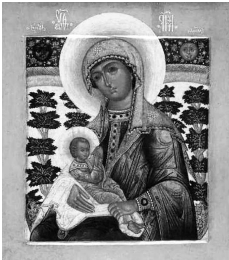
Икона Пресвятой Богородицы «Млекопитательница»