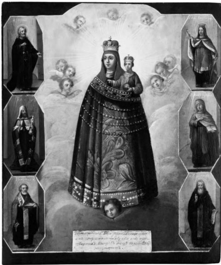
Икона Пресвятой Богородицы «Прибавление ума»