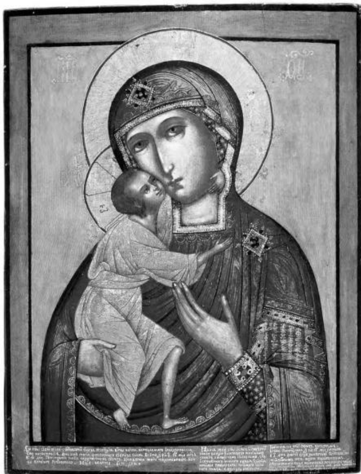
Икона Пресвятой Богородицы «Феодоровская»