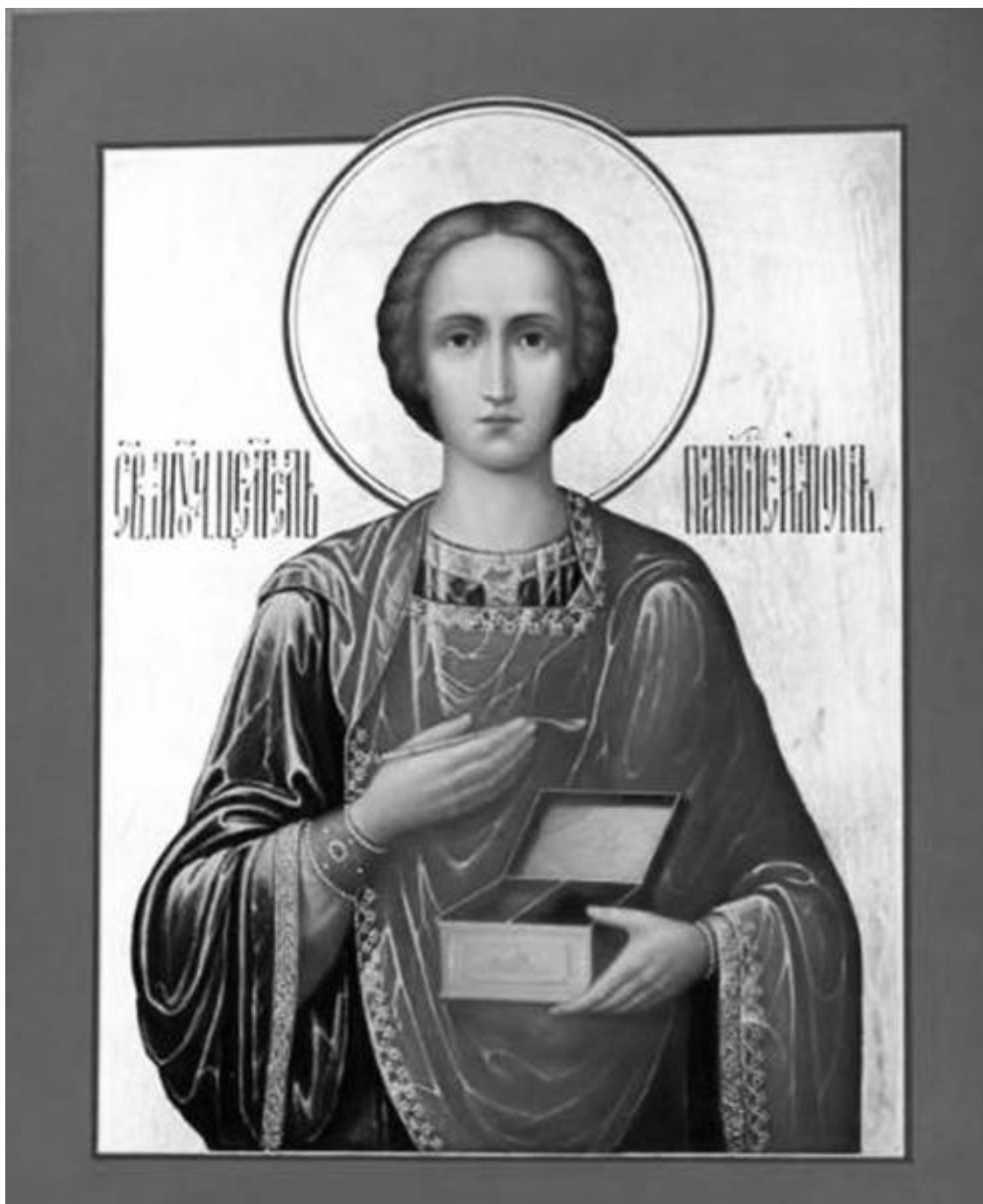
Икона великомученика и целителя Пантелеимона