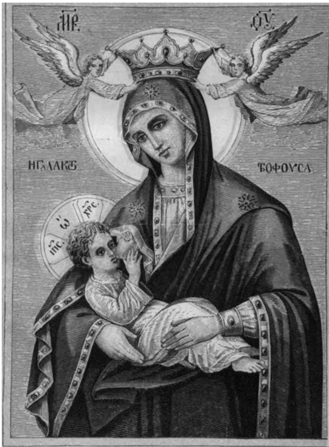
Икона Пресвятой Богородицы «Млекопитательница»